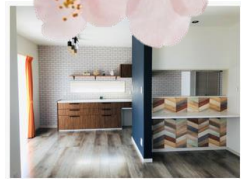
クロス使いが楽しいDK ♪

快適で省エネにこだわる「ファースの家」を知ってもらうには実際に見て・聞いて・体感していただくのがイチバン！！連休でお出かけの際には、ぜひご家族皆さままでお立ち寄りください。