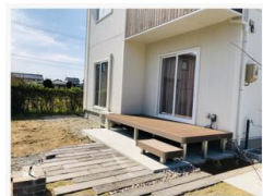
南側に面したデッキスペース