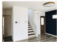
人気のリビング階段を採用